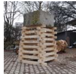
»Ich habe Angst« 2014 Stein, Holzbalken 230 x 140 x 140 cm

Geboren 1979 in Tokio / 2003 B.F.A. und 2005 M.F.A. in Bildhauerei an der Tokyo University of the Arts / 2007-2012 Assistent an der Tokyo University of the Arts / Seit 2012 künstlerische Tätigkeit in Deutschland und Studium an der Staatlichen Akademie der bildenden Künste Stuttgart