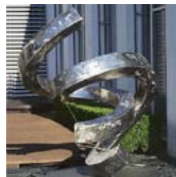
»Raumschleuder« 2013 VA-Stahl Höhe 140 cm