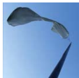
»Windenergie-Skulpturen-Kinox« 2014 reaktive, pneumatische Plastik 300 x 100 x 100 cm 2014

Geboren 1975 in Mainz / 1994-1996 Studium Filmwissenschaft und Kunstgeschichte in Mainz / 1996-1999 Bildende Kunst und Mathematik in Köln / 1999-2006 Studium der Medienkunst an der KHM Köln, Diplom im Bereich Audiovisuelle Medien / 2012 Lehrauftrag Hochschule Niederrhein