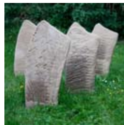
»Bewegte Flügel« 2013 Ziegel je 50 x 25 cm

Geboren 1951 in Ravensburg / 1981-1986 Studium der freien Kunst an der Gesamthochschule Kassel / 1985/1986 Studienaufenthalt in Nepal und Indien / 1987 Gasthörerin an der Bellas Artes in Porto / 1988 Preisträgerin der Darmstädter Sezession / Mitglied seit 1988