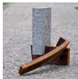
»Gen Mittag« 2012 Granit/Stahl 133 x 95 x 200 cm

Geboren 1957 in Benthe / 1977-1983 Studium der Bildhauerei an der Hochschule der Künste Berlin / 1983 Meisterschüler von Bernhard Heiliger / 1992-1997 Dozent an der Werkakademie für Gestaltung Hannover / 1995 Förderpreisträger der Darmstädter Sezession / Mitglied seit 1996