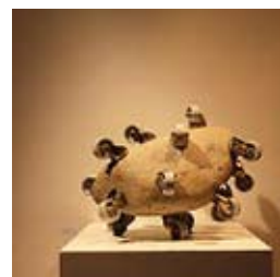
»Rolling Stone - Steppenwolf« 2012 Granit, Messing, Gummi 80 x 50 x 40 cm

Geboren 1984 in Lübeck / 2006-2012 Studium der Bildhauerei, Kunstgeschichte, Kunstpädagogik sowie Theater-, Film- und Medienwissenschaften in Frankfurt / 2012-2014 Studium der Bildhauerei an der Kunsthochschule Weißensee, Berlin