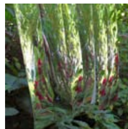
»Liquid Walk« 2014 Spiegelfolie, Nylonschnüre, Stahldraht variable Größe

Geboren 1949 in Schwäbisch Gmünd / 1972-1973 Studium Kunstgeschichte und Philosophie, Universität Stuttgart / 1975-1977 Staatliche Akademie der Bildenden Künste Karlsruhe / 1977-1980 Staatliche Hochschule für Bildende Künste Frankfurt, Städelschule / Meisterschülerin