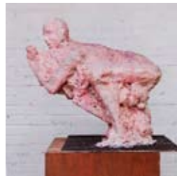
»G. G.« 2013 Kunstharz Höhe 80 cm

Geboren 1976 in Nürnberg / 2003-2009 Studium an der Kunsthochschule Kassel, an der Universität der Künste Berlin und an der Kunstakademie in Düsseldorf