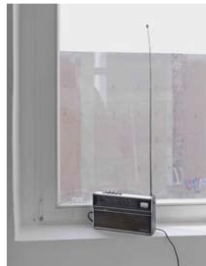
»Autobahn« 2010 Radio, Sendemontage aus Verkehrsnachrichten als Loop 40:04 min