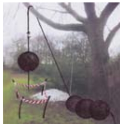
»Gleich« 2014 Stahlkugeln, Stahlseil variable Größe

Geboren 1951 in Bernried am Starnberger See / Autodidakt / 1981 Beginn künstlerischer Arbeit, vorwiegend auf dem Gebiet der Bildhauerei / 1992 Aufnahme in den Bund Bildender Künstler / Mitglied der Sezession seit 2012