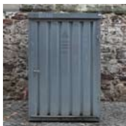
»Nemesis I« 2013 Blechcontainer, Elektromotoren, Steuerungselektronik 218 x 138 x 120 cm

Geboren 1987 in Karlsruhe / 2008-2012 B.A. in Politikwissenschaften an der Universität Konstanz / 2009 Auslandsstipendium des DAAD in Kambodscha / 2009/2010 Semesterstipendium des DAAD in Sao Paulo / seit 2012 Studium der Bildhauerei an der Kunstakademie Halle