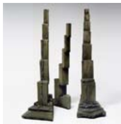
»Stufung I, II und III« 2014 Terrakotta, gebaut je ca. 130 x 35 x 50 cm

Geboren 1942 in Viersen / 1963-1964 Studium der Kunstgeschichte und Philosophie an der Universität Köln / 1964-1968 Studium an der Hochschule für Bildende Künste in Kassel / 1984 Preisträger der Darmstädter Sezession / Mitglied der Sezession seit 1984