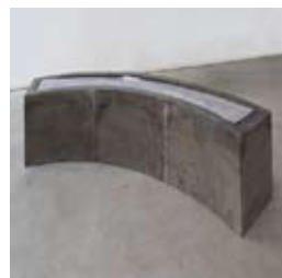
»Konzentrisch zum Boden« 2013 Beton, Blei 60 x 220 x 40 cm

Geboren 1983 / Seit 2009 Studium der Freien Kunst und der Bildhauerei an der Staatlichen Akademie der Bildenden Künste Karlsruhe bei Prof. Klingelhöller