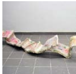
»Entlasten« 2013 Beton 260 x 90 x 110 cm