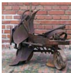
»Transport« 2014 Eisen Höhe 125, Breite 75 cm