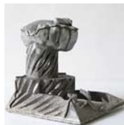
»Sich öffnende Hand« 2014 Aluminiumguss 80 x 80 x 80 cm

Geboren 1962 in Darmstadt / 1984-1989 Studium an der Akademie der Bildenden Künste, Karlsruhe bei Hiromi Akiyama / 2000-2003 Studium der Kunstgeschichte, der christlichen und klassischen Archäologie an der Universität Mainz