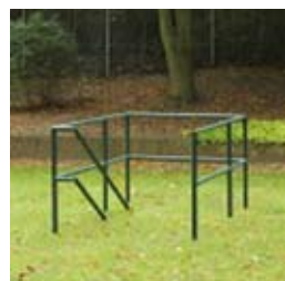
»Objekt 25« 2012 Baustahl, pulverbeschichtet 90 x 130 x 200 cm