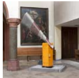
»Die ungehörige Schranke« 2011 Parkhaussschranke, Druckluftzylinder, Ventil, Steuerelektronik 300 x 120 x 150 cm