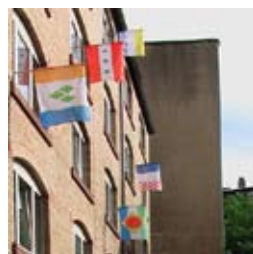
»Flagge hissen« 2008 Flaggen aus bedrucktem Polyester 80 x 120 cm je Flagge

Geboren 1974 in Köln / 1995-1998 Berufsausbildung zur Holzbildhauerin in Michelstadt im Odenwald / 1998-2006 Studium der Visuellen Kommunikation an der Hochschule für Gestaltung in Offenbach / 2006 Diplom