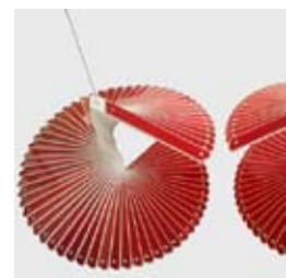
»Reflexio 4« 2014 Reflektoren, Stahl, Motor 165 x 115 cm

* 1978 in Annaberg / 1998-2004 Studium der Kunstgeschichte, Kulturwissenschaft und Religionswissenschaft an der Universität Leipzig