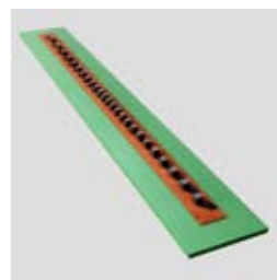
»Schattenwürfel/Würfelschatten 21. Juni 1987, 6.00-18.00 Uhr, 46° 30'40" Nördliche Breite, 6° 39'45" Östliche Länge 1988/89 Plexiglas lackiert, Metall, Holz 221 x 21 x 31 cm

Geboren 1943 in Landsberg am Lech / 1962-1967 Studium an der École Cantonale d'Art de Lausanne / 1997 Wilhelm-Loth-Preis der Stadt Darmstadt / 2003 Johann-Heinrich-Merck-Preis der Stadt Darmstadt / Mitglied der Sezession seit 1990